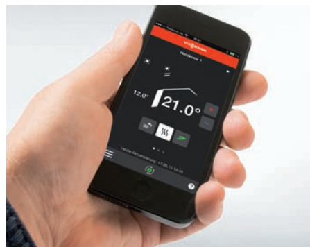
Comunicarea cu instalația termică direct de pe un dispozitiv mobil prin intermediul unei aplicații Viessmann

Cazanul compact pe lemn cu gazeificare este și un excepțional generator de energie termică pentru instalațiile de încălzire pe gaz sau combustibil lichid existente. În regim bivalent, cazanul pe combustibil solid preia sarcina încălzirii și preparării apei calde menajere. La temperaturi extrem de scăzute, se conectează și cazanul convențional pentru a prelua din sarcină de vârf.