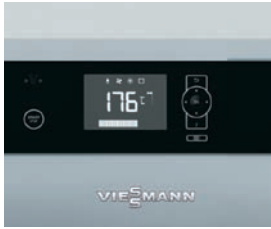
Automatizare Ecotronic 100 intuitivă, cu ecran iluminat

Vitoligno 150-S este un cazan pe lemn cu gazeificare, compact și la un preț atractiv, adecvat atât pentru o funcționare în regim monovalent cât și în regim bivalent (în completarea unei instalații termice pe gaz sau combustibil lichid).